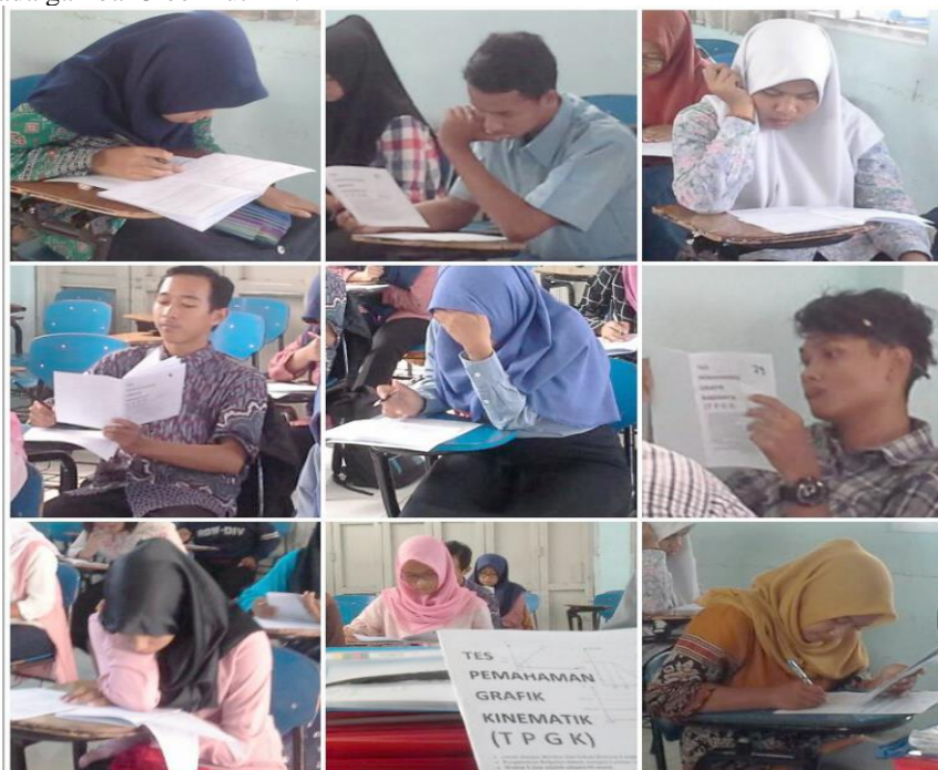
Gambar 3. Dokumentasi kegiatan penelitian

Adapun dokumentasi kegiatan penelitian berupa keterlaksanaan kegiatan tes pemahaman grafik kinematik dapat dilihat pada gambar 3 berikut ini :