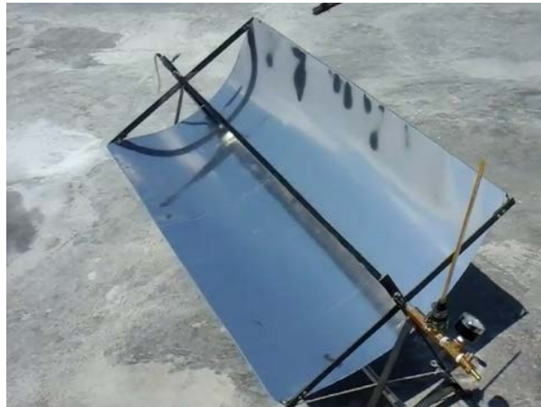
Gambar 2. Mini parabolic through collector sederhana

perubahan suhu air dalam pipa dan tekanan yang dihasilkan dari proses pemanasan air menggunakan energi matahari. Pengukuran menggunakan alat ukur termometer dan barometer sederhana.